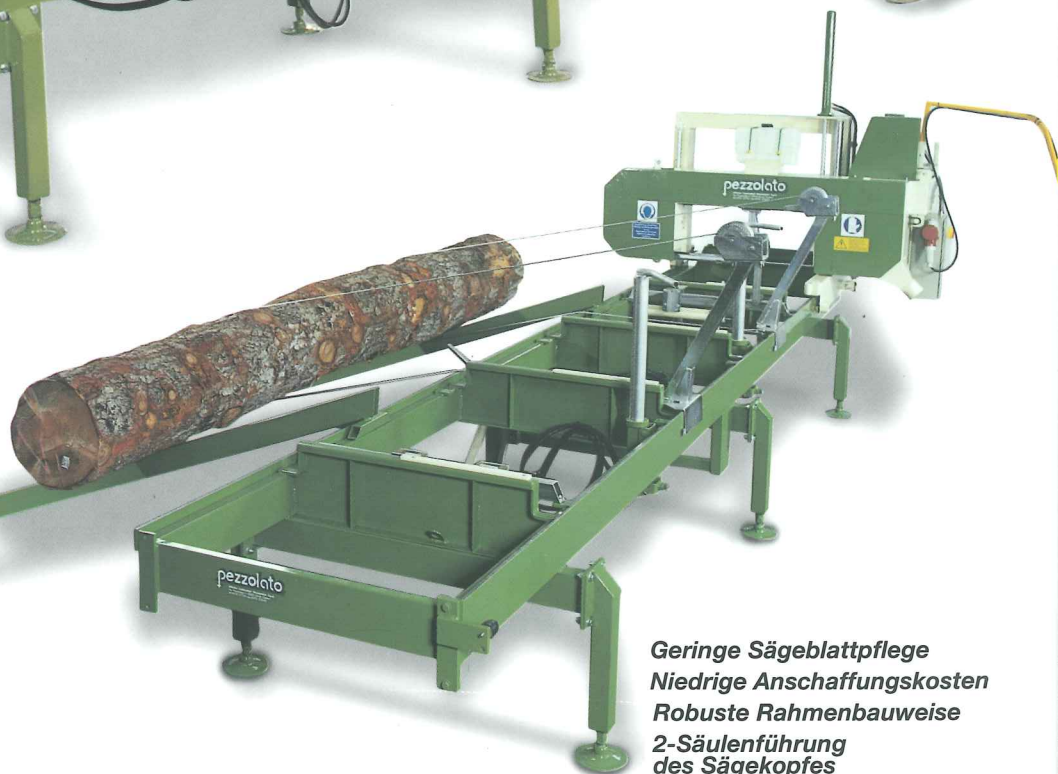
Timber Queen S hydr. Stammklammer