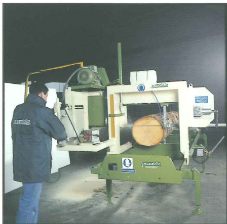
Timber Queen S Sägekopf mit Bedienerstand

...denn Holz- und Qualitätsanforderungen sind für alle gleich!