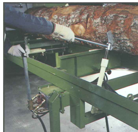
Timber Queen S hydr. Stammwender

Die Timber Queen S aus dem Hause PEZZOLATO ist das preisgünstigste Kleinsägewerk mit der besten Standardausrüstung auf dem Markt.