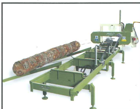
Timber Queen S Stammladen