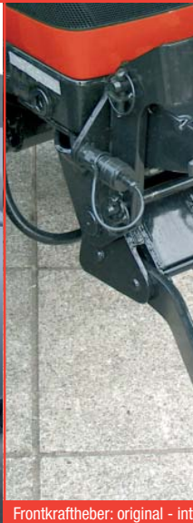
Frontkraftheber: original - inte