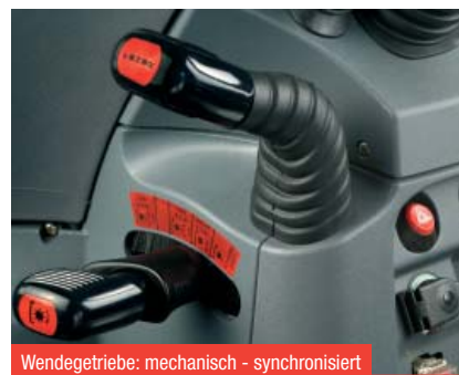
Wendegetriebe: mechanisch - synchronisiert