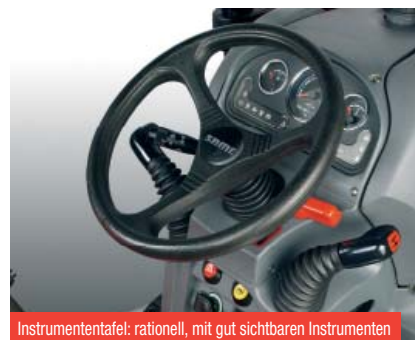
Instrumententafel: rationell, mit gut sichtbaren Instrumenten

Die von einer speziellen Pumpe mit einer Förderleistung von 15 l/min gespeiste, hydrostatische Lenkung (serienmäßig bei allen Modellen) ist auch bei niedriger Drehzahl sehr leichtgängig. Zapfwellenausstattung: Heckzapfwelle mit 540/1000 U/min und Wegzapfwelle, Zwischenachszapfwelle mit 1000/2000 U/min. Die völlig unabhängige elektrohydraulisch betätigte Frontzapfwelle läuft mit 1000 U/min. Für die Bremsicherheit des Traktors sorgt eine wirkungsvolle Bremsanlage mit Scheibenbremsen im Ölbad.