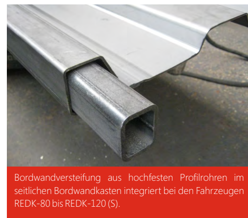
Bordwandversteifung aus hochfesten Profilrohren im seitlichen Bordwandkasten integriert bei den Fahrzeugen REDK-80 bis REDK-120 (S).

Sonderausstattung: Hydr. Bremse für Export