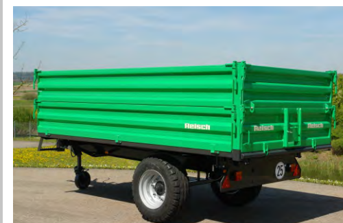
Verstärkte Eckrungen steckbar mit Komfortverschlüssen, Kornschieber hinten, Sicherheitssystem gegen diagonales abstecken der Kippbolzen, Zentralverriegelung hinten. (S)