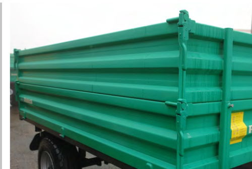
REDK - 30 mit selbstspannendem Komfortverschluss und Sicherheitsverriegelung (S)

2 - Rad Seilzugbremse mit Handhebel auf Zugvorrichtung montiert (S).