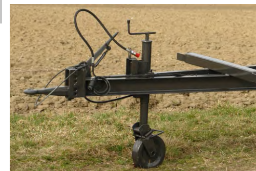
Verstellbare Zugöse mit Handhebelbremse auf Zugvorrichtung montiert, Höhenverstellbares Klappstützrad, Verbindungsseil zum Zugfahrzeug nach StVZO (S)

S - Serienausrüstung, SA - Sonderausrüstung