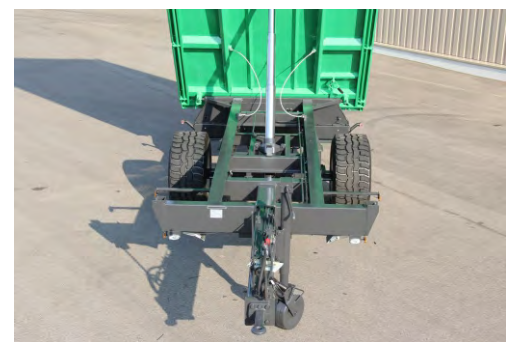
Hochfester Profilrahmen in Kastenbauweise mit verstärktem Kippträger (S)

S - Serienausrüstung, SA - Sonderausrüstung