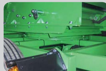
Fahrgestell mit Drehkranz