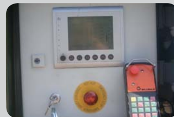
Schaltschrank mit Funkfernsteuerung