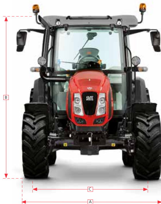
Explorer LD (MY 2019)