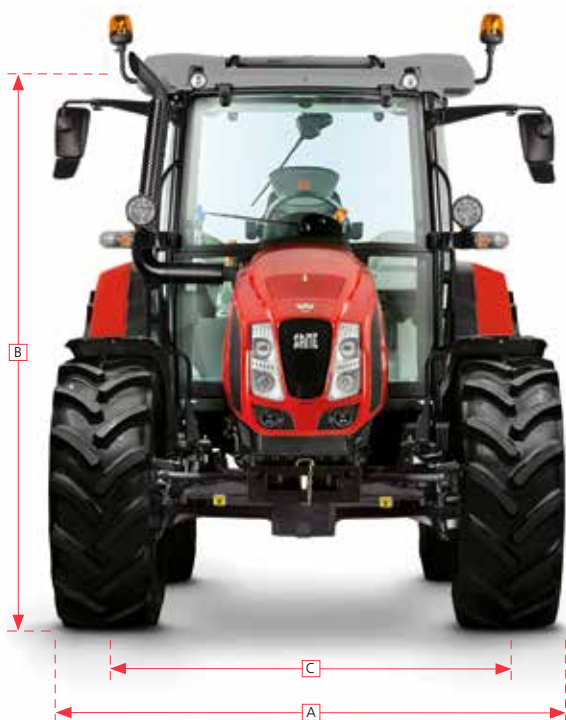
Explorer MD (MY 2019)