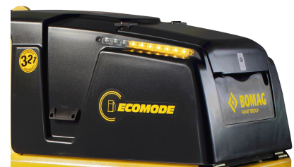
Più qualità, meno costi ECONOMIZER - Il display della compattazione (opzione)