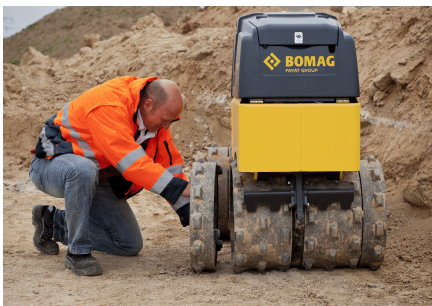
Larghezze di lavoro flessibili Allargamenti tamburo originali BOMAG