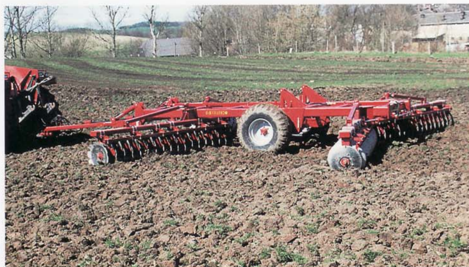
BK-GHXL 800 im Einsatz