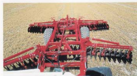
BK-GHX 680 mit Rohrpacker 500 ø mm