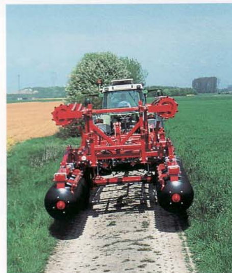
BK-GHX 680 Transport