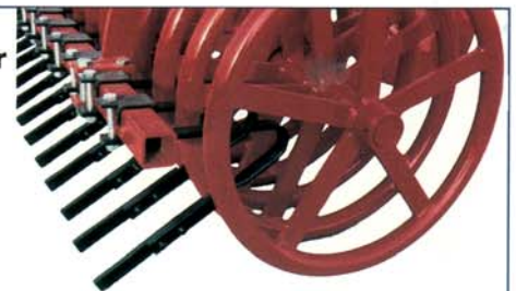
Ringpacker RR 600.

Ø 600 mm, Rundrohr mit 5 Speichen, 23 Ringe auf 3 m. Auch mit Abstreifer und Striegel für effektive Krümelung und Mischung