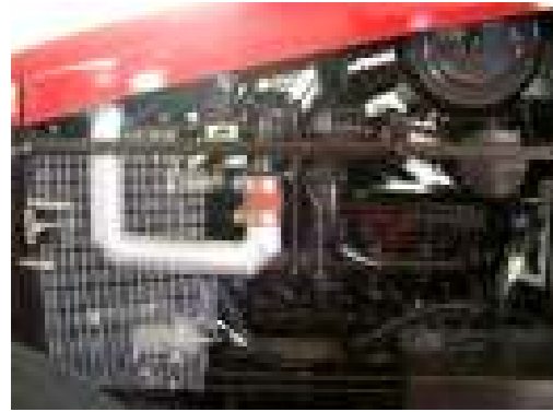
MTS 1523.4 mit 160 PS