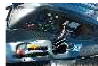
MTS 1523.4 oder 2022.4 Bosch EHR, Bosch Steuerblock Hohe Zapfwellenleistung