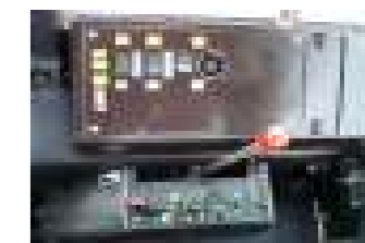
MTS 1220.3 oder 1221.4 Bosch EHR, elektrohydraulische Bedienung von Zapfwelle, Allrad und Differentialsperre