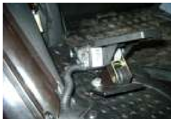
Motorsteuerung über elektronisches Gaspedal

Motor Typ TCD 2012 L06 2V Abgaswerte Stufe IIIA 142 PS im MTS 1221.4 160 PS im MTS 1523.4 TCD 2013 L062V 225 PS im MTS 2022.4