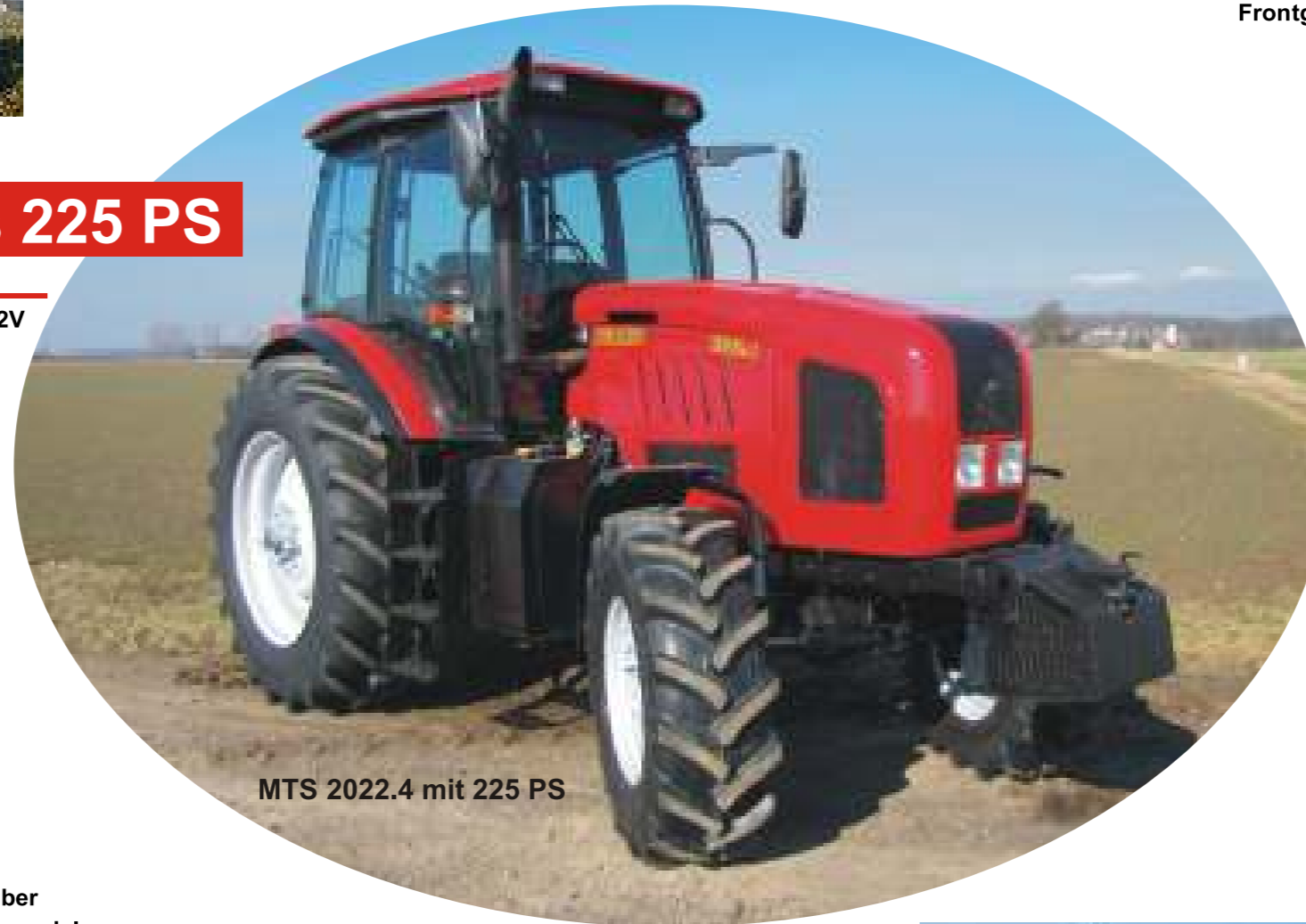
MTS 2022.4 mit 225 PS