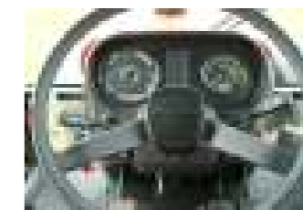
Alle Funktionen im Blick