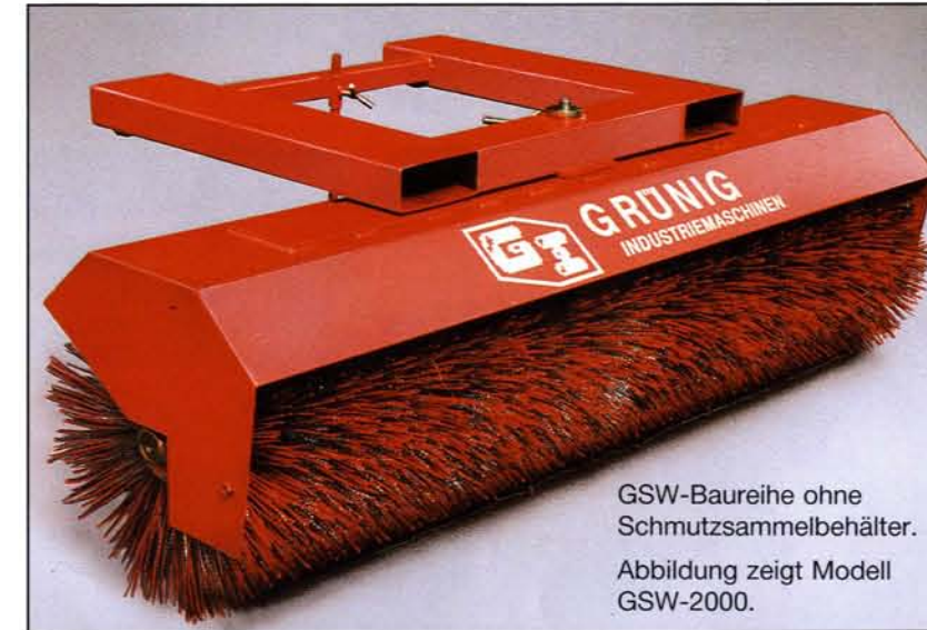
GSW-Baureihe ohne Schmutzsammelbehälter. Abbildung zeigt Modell GSW-2000.