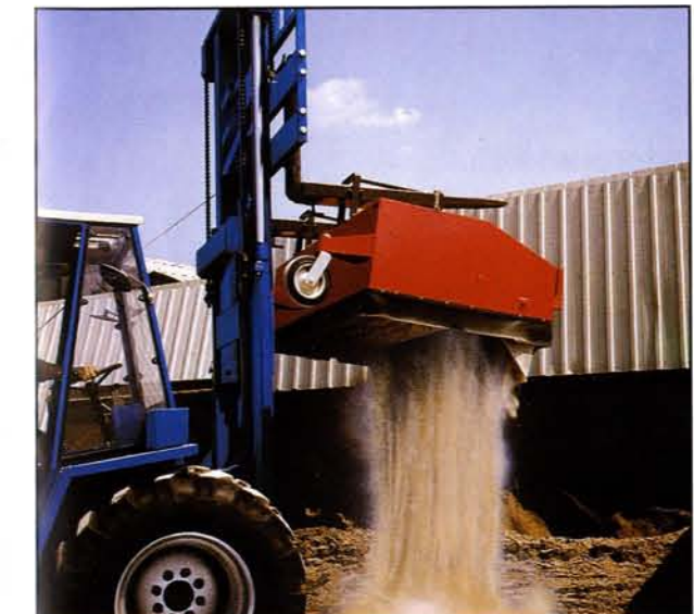
Hochentleerung der Kehrmaschine mit Fernbetätigung vom Trägerfahrzeug. (GSX-Baureihe)

Die Herstellung von robusten, langlebigen, leistungsfähigen, einfach bedienbaren und bei alledem wirtschaftlich einsetzbaren Maschinen, die Maßstäbe setzen.