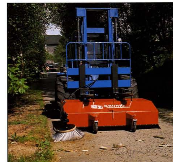
Anhängung an die Palettengabeln eines Gabelstaplers oder Radladers.