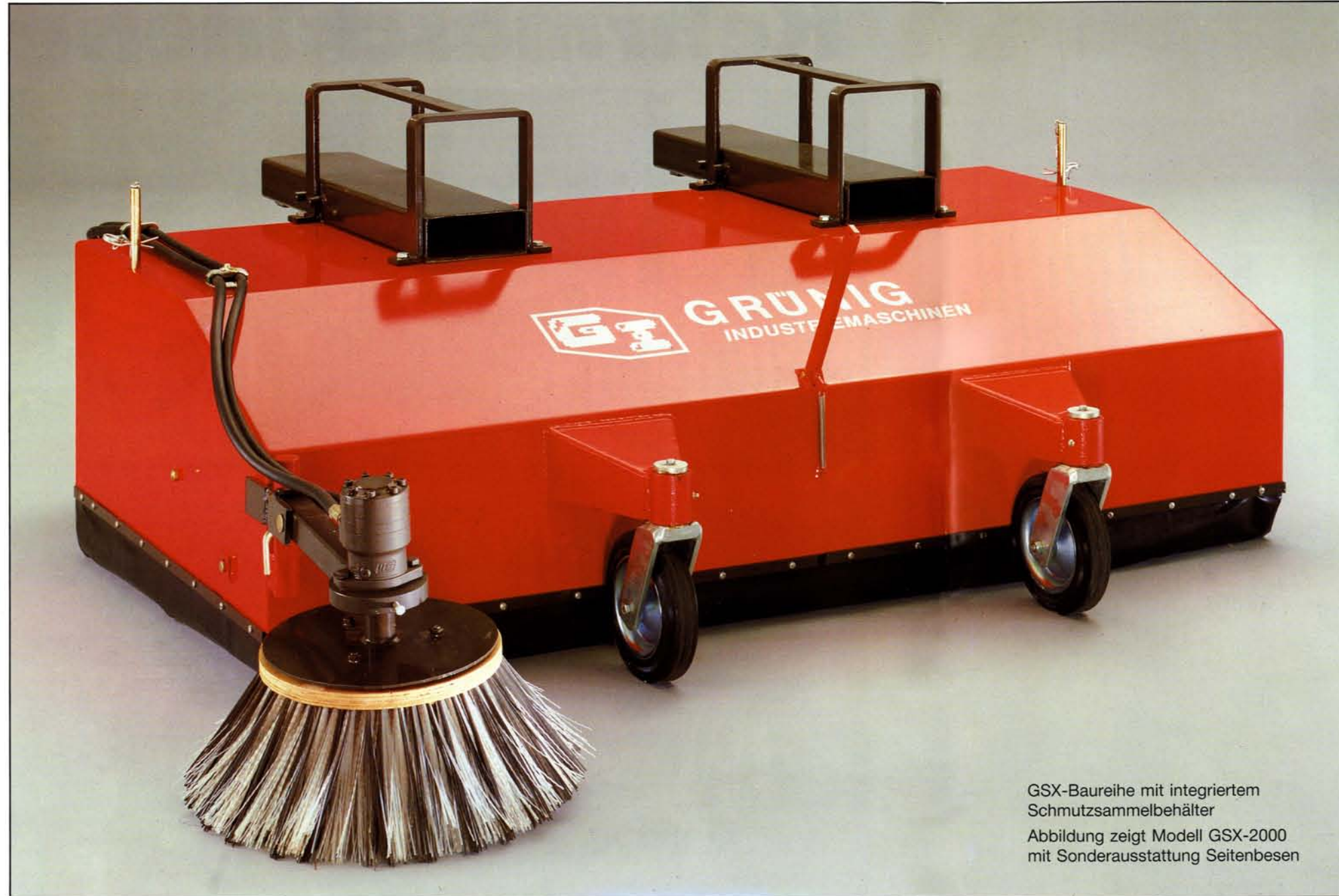
GSX-Baureihe mit integriertem Schmutzsammelbehälter Abbildung zeigt Modell GSX-2000 mit Sonderausstattung Seitenbesen