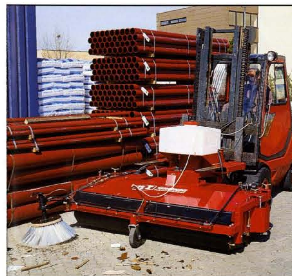
GSO-Baureihe mit abnehmbarem Schmutzsammelbehälter