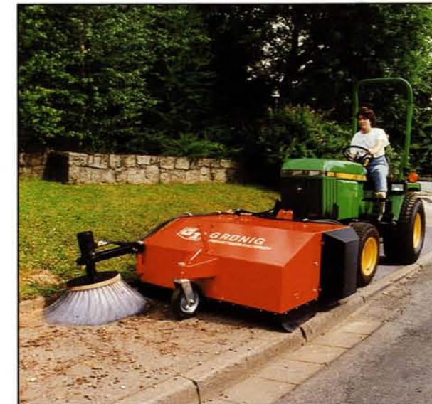
Einhängung in Frontdreieck, Frontlader oder Dreipunktaufnahme eines Traktors.