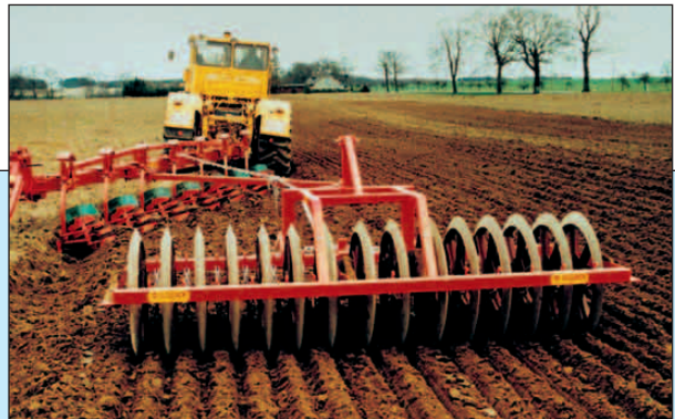
Enrækket pakker som efterløber efter liftplov

Enrækket jordpakker Knastpakker Dobbeltpakker Frontpakker