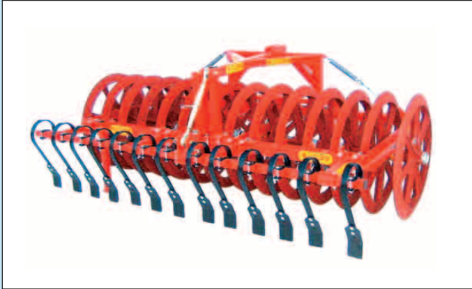
B 14/90 F med crossplanerer

Frontpakker for økonomisk udnyttelse af fronthydraulikken.