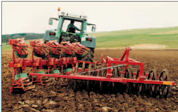
Dobbeltpakker som efterløber efter vendeplov