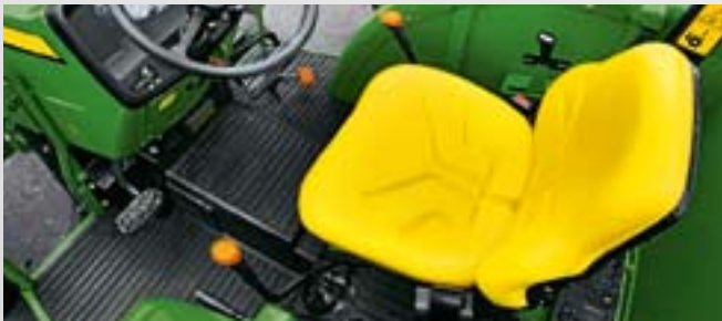
Leichtes Auf- und Absitzen Sie können beliebig von beiden Seiten aufsteigen.