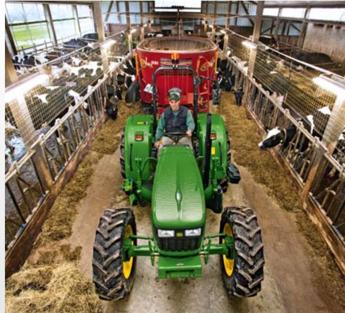
Erhabenes Fahrgefühl Die schall- und schwingungsgedämpfte Fahrerplattform schützt Sie vor Stößen und Vibrationen.