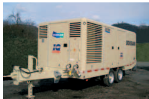
25/330 op optionele hogesnelheidsstandaard en uitgerust met optioneel IQ-systeem.